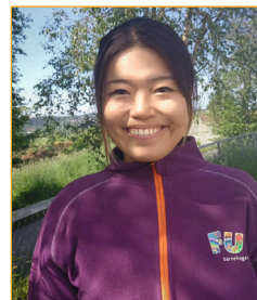
Eri Hosen Barne Ungdomsarbeider