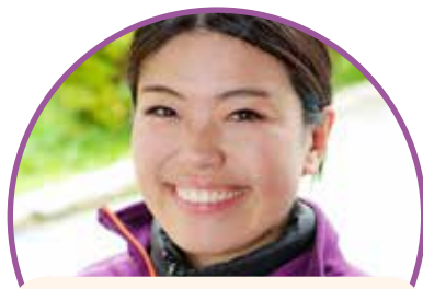
Eri Hosen Barne og ungdomsarbeider