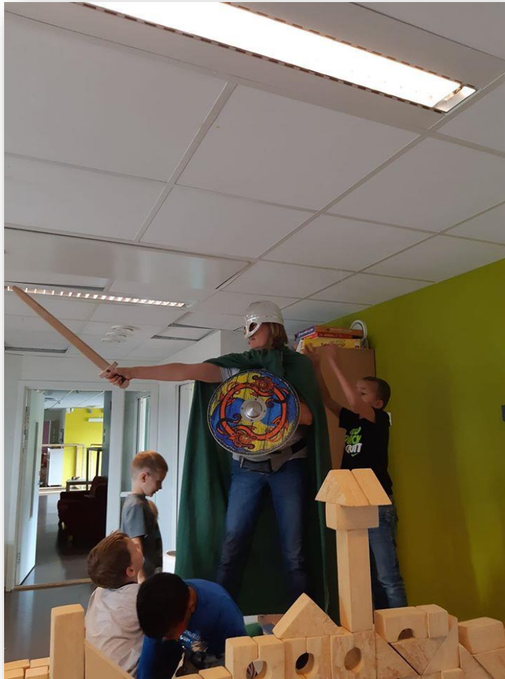
Vaila og unga på tokt

Gjennom deltagelse i et fellesskap opplever barna skaperglede, mestring, tilhørighet og nysgjerrighet. De utforsker, får utfordring, og erverver seg ny kunnskap sammen med andre barn og ansatte.